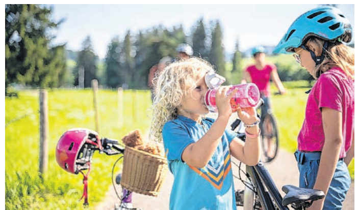
Pause machen! Eine Radtour hat keinen Zeitdruck.

Einkehren: Gaisbock – die Dorfalpe, Gasthof Rubihorn, Käshüs oder SpeiseGalerie Fiskina