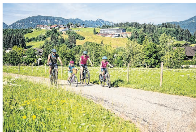
Frisches Grün und herrliche Aussicht. Auf dem Rad gibt's mehr davon.

Wenn man am Abend gemütlich zur Unterkunft zurückrollt und die letzten Sonnenstrahlen die Gipfel in warme Farben tauchen, stellt man fest: Man hat eben nicht nur Kilometer gesammelt und Strecke gemacht. Man nimmt einen ruhigen Kopf mit nach Hause. Vielleicht das wertvollste Souvenir, das man von einer Radtour mitbringen kann.