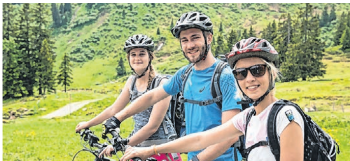
Gemeinsam abschalten und die Allgäuer Bergwelt genießen.

Start ist am Kitzebichl, zunächst locker bergab. Dann folgt der erste längere Anstieg nach Höldersberg. Mit jedem Höhenmeter öffnet sich das Panorama weiter über das Illertal. Über einen Mix aus Teer und Schotter geht es Richtung Maderhalm. Kurz vor dem Ziel zieht die Strecke noch einmal spürbar an. Ein guter Test für die eigene Kraft oder die Kraftreserven des Akkus. Der Blick auf die Allgäuer Bergkette entschädigt sofort für die Anstrengung. Einkehren: Café am Minigolfplatz, Restaurant Kitzebichl, Restaurant Seehaus, Restaurant Schreinerstube, Hornstüble